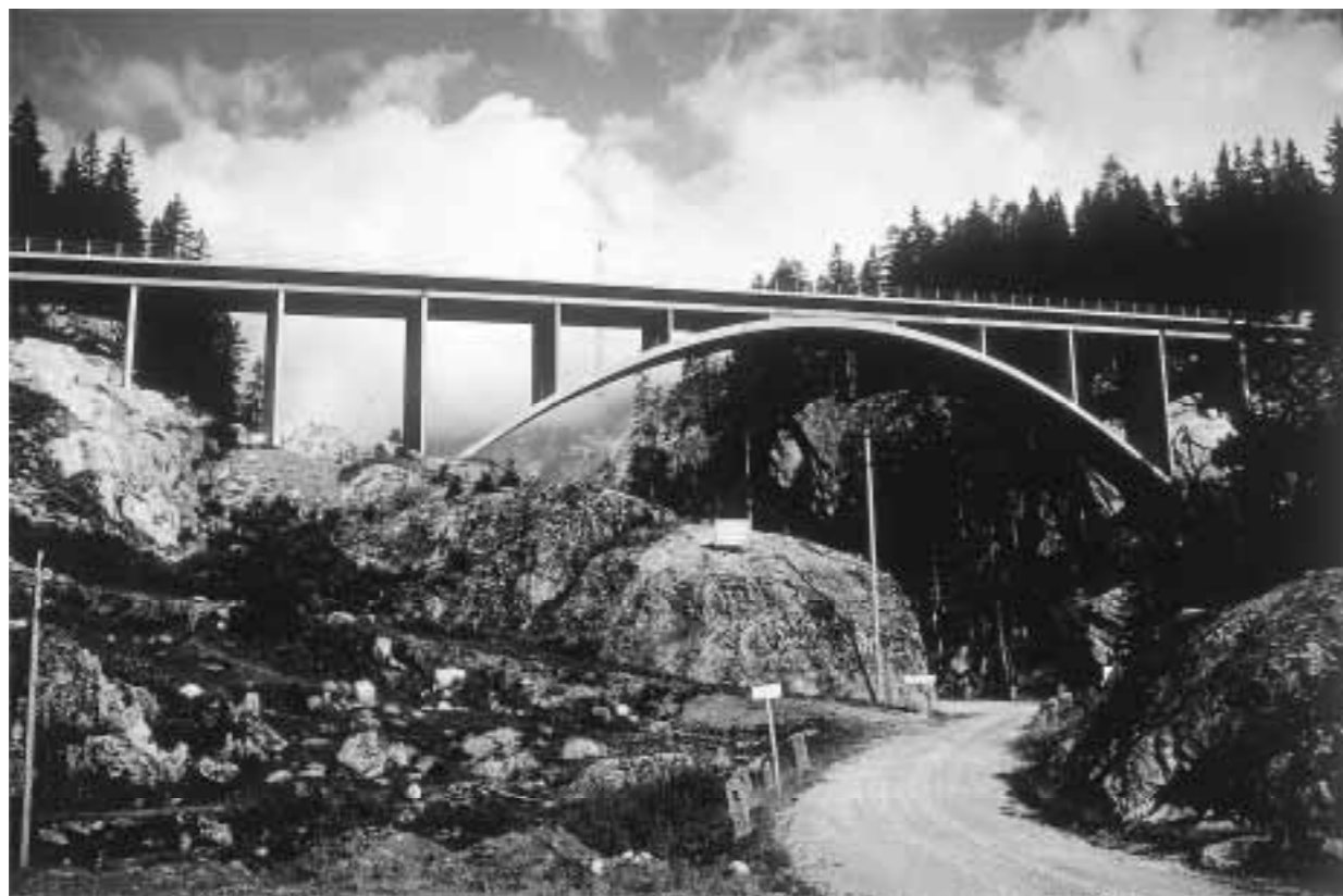
Christian Menn: Crestawaldbrücke, Sufers, 1959.

Gelände. Die Crestawaldbrücke hingegen wird mit Hilfe des Fahrbahnträgers ausgesteift. Der Bogen und die verbindenden Stützen werden hierdurch entlastet und können schlank gehalten werden. Dies führt zu einer hohen Transparenz des Bauwerks und betont die Öffnung des Tals. Durch die Grosszügigkeit der Linienführung des Bogens scheint die Brücke entspannt in der umgebenden Landschaft zu ruhen.