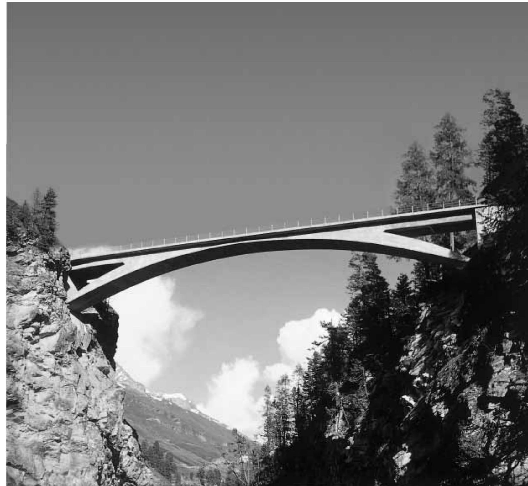
Christian Menn: Letziwaldbrücke, Avers Cresta, 1960.

Dies wird bei den erwähnten Brücken von Christian Menn besonders deutlich: Bei beiden wird die Stabilisierung durch das gleiche Prinzip des Zusammenspiels von Bogen und Fahrbahnträger erreicht. Bei der Letziwaldbrücke erfolgt die Aussteifung der Brücke vor allem durch den Bogen, der kräftig gestaltet ist, in Anlehnung an die Salginatobelbrücke von Robert Maillart eine variable Höhe aufweist und monolithisch mit dem schlankeren Träger verschmilzt. Die dadurch möglich gewordene kleinere Pfeilhöhe verleiht dem Bauwerk eine ausserordentliche Dynamik, die durch die Formgebung des Bogens noch verstärkt wird. Die anschwellende Linienführung gibt der Brücke eine angespannte Konzentriertheit – wie eine Wildkatze im Sprung überwindet die Letziwaldbrücke die steil abfallende Schlucht. Die Dominanz des Bogens sowohl in statischer wie auch in visueller Sicht unterstreicht den mutigen Brückenschlag im topografisch schwierigen