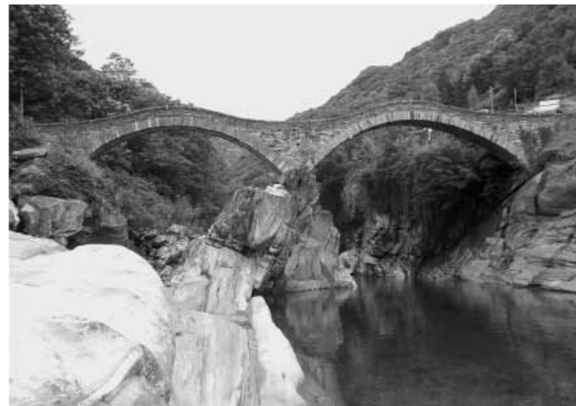
Ponte dei Salti, Lavertezzo, verm. 18. Jh., nach der Überschwemmung von 1951 erneuert.

Das Elegante hat also sowohl rationale wie auch sinnliche Aspekte. Die Eleganz des Rationalen offenbart sich aber nicht wie häufig angenommen in der mathematischen Beschreibung der statischen Gesetzmässigkeiten, sondern im Denken, das durch Formeln und abstrakte Beschreibungen ausgedrückt wird. Es offenbart sich in den Beweisen der mathematischen Aussagen, in denen sich die rationale Eleganz zeigt. So schreibt Hans Magnus Enzensberger: «Es ist kein Zufall, dass den meisten Mathematikern ästhetische Kriterien nicht fremd sind. Es genügt ihnen nicht, dass ein Beweis stringent ist; ihr Ehrgeiz zielt auf «Eleganz.» Und Henri Poincaré ergänzt: «Das Ästhetische mehr als das Logische ist die dominierende Komponente in der mathematischen Kreativität.» Dieses Ästhetische, die Eleganz im Rationalen, zeigt sich im Dreiklang von Transparenz, Stringenz und Leichtigkeit. Mit der Transparenz wird das Komplizierte einfach und folgerichtig, mit der Stringenz wird deutlich, worauf es wirklich ankommt und die Methodik der Argumentation lässt für einen Augenblick die Leichtigkeit des Denkens erahnen.