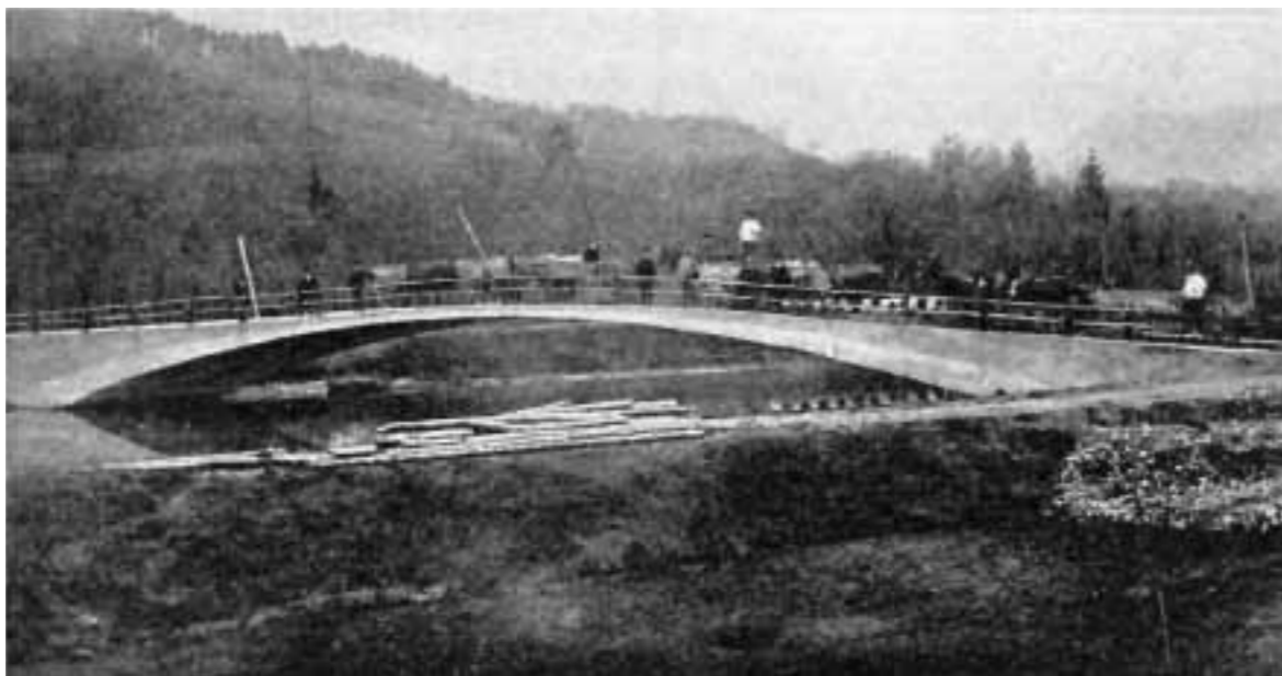
Brücke der Juracementwerke, Wildeg, 1890, nach Belastungsversuchen 1974 abgebrochen.

nier ermöglichte es, den mutigen Brückenschlag von 37 m einfeldrig bei einer Pfeilhöhe von 3,5 m und einer minimalen Bogenstärke im Scheitel von nur 20 cm zu realisieren. Der Brückenbogen scheint bis an die Grenze des Möglichen gedehnt worden zu sein, während die massiven Brückenköpfe am Ufer fest verankert in sich ruhen. Durch die geringe Pfeilhöhe fügt sich der Brückenkörper in die Umgebung ein und verbindet die beiden Uferseiten durch seine minimale Erscheinung auf zurückhaltende Weise. Der herausragende Gestaltungswille wird in diesem Herantasten an die Geometrie der physikalischen Limite spürbar. Wichtige Randbedingungen wie der Bauvorgang und die Frage der Wirtschaftlichkeit dienen als Triebfedern bei der Reduktion auf das absolut Notwendige. Aus diesem Drang zum kontinuierlichen Rationalisieren der Gegebenheiten entspringt die elegante Erscheinung der Brücke.